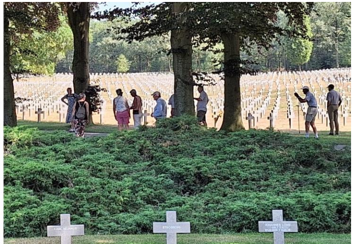
Links uitleg bij informatiebord en rechts op de begraafplaats te Ysselsteyn.

Zaterdag 8 juli in alle vroegte, werd er vanuit Zundert vertrokken met 'De Stille Kempen' naar het Oorlogsmuseum te Overloon. Daar aangekomen en nadat de koffie was genuttigd, werd de groep opgedeeld en werd er een heel goede uitleg gegeven van hetgeen er in het museum allemaal te zien is, hier en daar aangevuld met wat persoonlijke herinneringen. Daarna kreeg iedereen de gelegenheid om het museum te bezoeken. Vervolgens werd er naar Liessel vertrokken voor de lunch gevolgd door het middagprogramma.