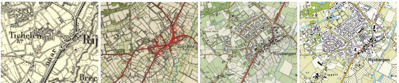
Dorpskern van de plaats Rijsbergen. V.l.n.r. 1860, 1960, 1995 en 2022.

In de onderstaande uitsneden van landkaarten, is de ontwikkeling en de uitbreiding van de dorpen Rijsbergen en Zundert goed te zien.