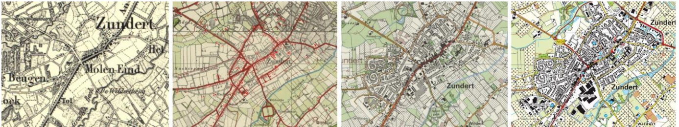
Dorpskern van de plaats Zundert. V.l.n.r. 1860, 1960, 1995 en 2022.

Tweeëntwintigste jaargang, nummer 12, december 2023