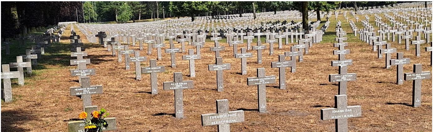
De indrukwekkende oorlogsbegraafplaats te Ysselsteyn.

Al rondtoerend kreeg het gezelschap een aardige indruk van de uitgestrekte natuur in De Peel. Ook geconstateerd dat er veel overeenkomsten zijn met Zundert; turf steken, turfvaarten met Jaagpaden, ontwikkeling van woeste gronden, boomkwekerijen, Mariakapelletjes en zelfs een Hazeldonksestraat. De excursie werd afgesloten met een koffietafel in Terheijden.