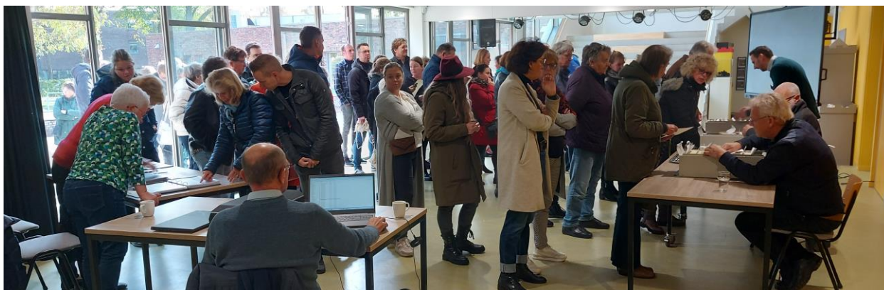
Drukke in de hal van het IKC bij het uitdelen van de leerlingenkaarten