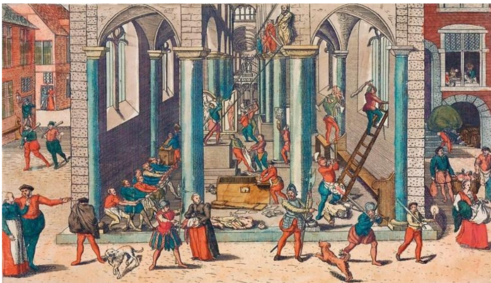
De Beeldenstorm, ets van Frans Hogenberg 1566.

Onrust in de Nederlandse samenleving is van alle tijden. In de zomer en herfst van 1566 raakten de gemoederen in het land oververhit. Een explosieve mix van religieuze, sociale en economische spanningen kwam op veel plaatsen tot een uitbarsting. Zundert bevond zich in het oog van de storm tussen Antwerpen en Breda waar beeldenstormers in augustus 1566 hebben toegeslagen.